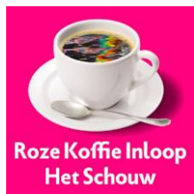
Roze Koffie Inloop Het Schouw

Nou, ook daar hebben wij een vol programma!